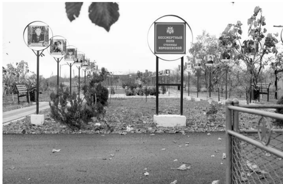
Аллея Бессмертного полка